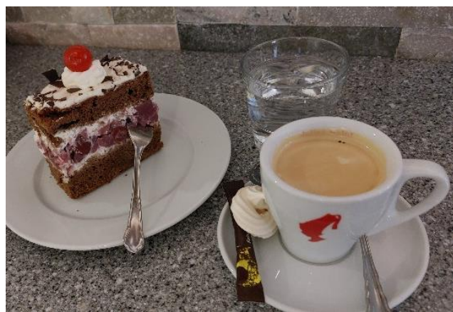
Mehlspeisen in der Kühlvitrine